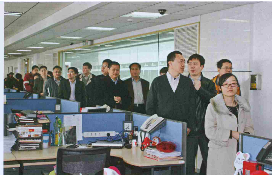
▲ 北京市政协委员赴新浪、搜狐网调研

自己的观点，这使得“民主”思想更深入人心。但我们还应看到的是，网络对人性的解放有可能使其走向另一个极端——个人主义。在个人主义心理作祟下，靠着匿名化的掩护，少数网民肆意散布虚假消息，攻击谩骂他人，网民彼此之间情绪激荡，这使得整个社会变得动荡。更重要的是，网络的开放特质使得涉世不深的青少年容易受到个人主义价值观和腐朽事物的影响，导致其社会化困难甚至失败。