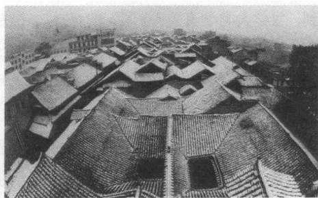
有“桃花源”之称的武陵地区

“桃花源”淳朴世界的诱惑，是费先生出行的原因之一。自称人类学界“一匹野马”的费先生，绝不讳言他的行走带有一种“非学术目的”。可这匹“野马”书写风格上的“非学术”，绝不等于无学术内容。费先生一九七九年开始其“第二次学术生命”，接续青年时代的“心史”。对他而言，重拾农村研究的同时，也是其民族研究的复兴。他于一九八四年对内蒙古、甘肃展开边区与民族地区发展研究，且三访广西大瑶山。一九九一年，可谓一个特殊的年份。费先生在深刻意识到自己年事已高的情况下，却执意考察了四川攀枝花市和凉山彝族自治州。还有这次武陵行，也是其西南地区考察计划的组成部分。武陵这个地方，此前他没有去过，但受潘光旦先生上世纪五十年代中期的土家族研究的感动，他早已热切地向往这个遥远的地