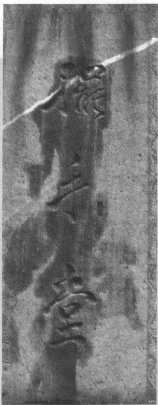
湖南龙山县飞虎洞中，建有一土家族洞穴摆手舞堂，洞口石碑“摆手堂”为费孝通生前所书

以前，封建时代的民族压迫把少数民族赶上山了，现在请他们下来行不行呢？我在广西访问时，从人道主义出发，当地的汉人也让出土地，请他们下山，结果不灵，少数民族不愿下山。他们自己为什么不愿意，是因为不适应。在什么条件下能使得他们适应呢？这值得研究。一九八八年，我到南宁去，南宁附近有一个从山上搬下来的瑶族村，种了菠萝，做了罐头，出口香港。村