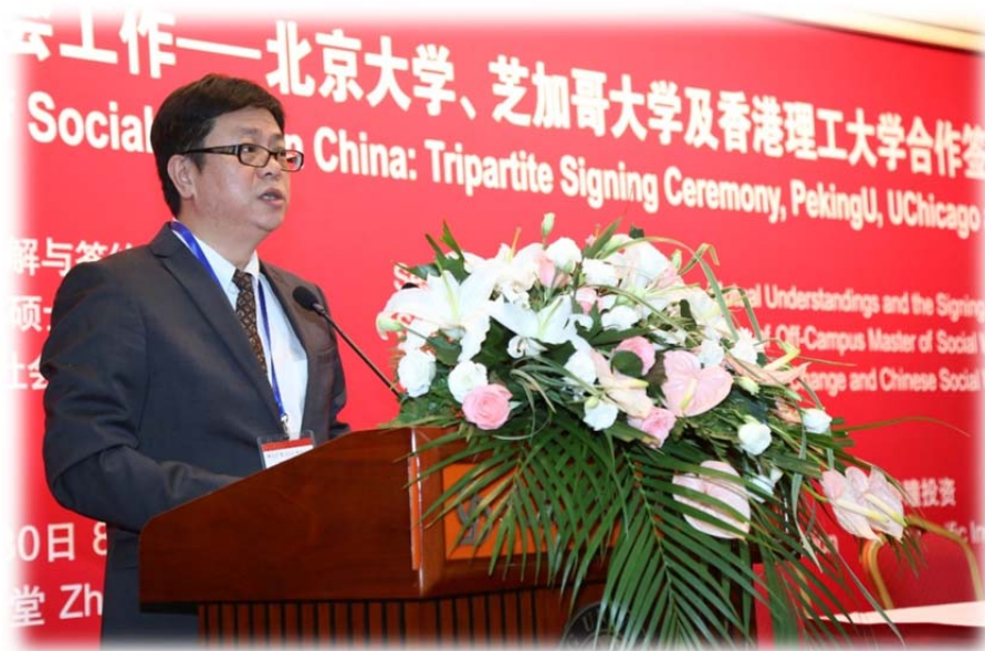
李岩松（北京大学副校长）

李岩松副校长在致辞中说，本次签约仪式标志着三校合作的起步，代表着以北京大学社会工作教育为代表的中国社会工作教育将进入一个以社会问题干预为目标，以社会政策实验为导向，国际社会工作知识体系和中国特色社会变迁具体情境有机结合的新时期。